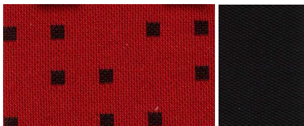
998955 / 998944 (rot / schwarz)