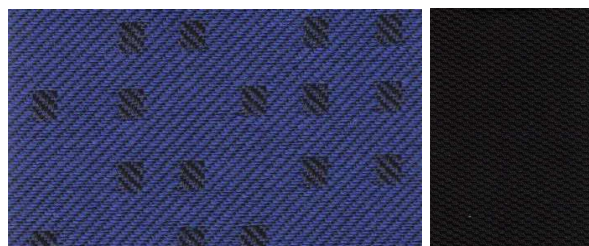
998966 / 998944 (blau / schwarz)