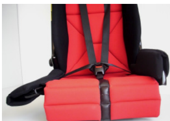
abklappbares Seitenteil Art.-Nr.: 300996