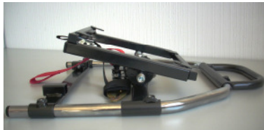
Autositz-Drehrahmen, Schrägverstellung, Klemmgelenk und Fußbankaufnahme Art.-Nr.: 300135