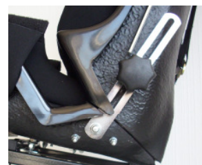
Rückenverstellung bis 160° Art.-Nr.: 300998