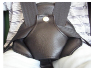
Gurtschlossabdeckung Art.-Nr.: 300114