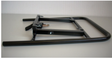
Autositzrahmen starr mit Aufnahme für Fußbank Art.-Nr.: 300120