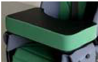
Unterarmlagerung gepolstert, verstellbar Art.-Nr.: 300180