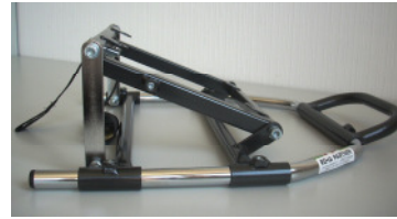
Autositzrahmen verstellbar mit Aufnahme für Fußbank und Doppelklemmgelenk Art.-Nr.: 300130