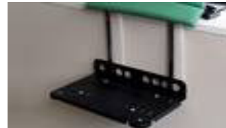
Beinführungssystem höhenverstellbar mit Fußbank Art.-Nr.: 300150